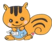
加津佐図書館 キャラクター りいど

延長をすると本を2週間長く借りることができるよ！ (予約が入っていると延長できないから注意してね)